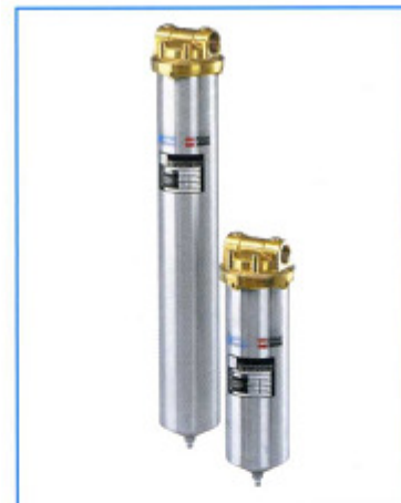
Series EKF "BE"

Ecocart EKF "BE"-serie cartridge filters zijn gemaakt voor een dubbele open einde DOE cartridges. Vervaardigd in RVS 304, ze bestaan uit een filterkop en een filterhuis, verbonden door een centrale staaf met een dopmoer. Deze zijn afgedicht met platte ring pakkingen. Het filterhuis is voorzien van een bodemdrain. Een optionele beugel is verkrijgbaar voor montage van het filter aan de wand.