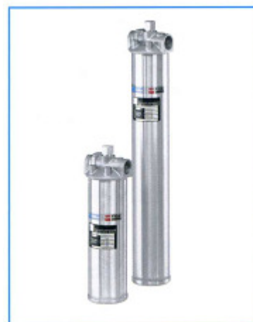
Series EKF "E"

Het filterhuis is voorzien van een bodemdrain. Een optionele beugel is verkrijgbaar voor montage van het filter aan de wand.